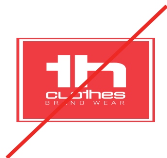
Deformar el logotipo