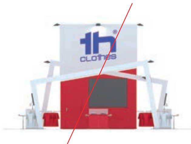
Cambiar los colores del logotipo