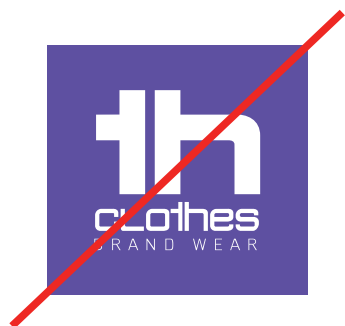
Fundos não institucionais