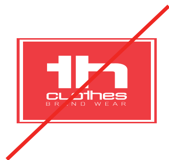
Déformer le logo