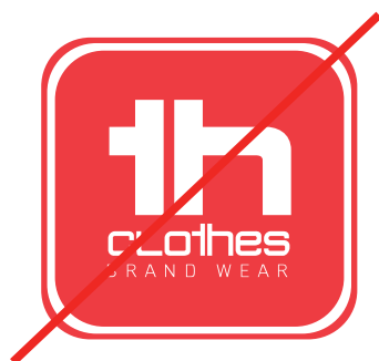
Changer de format