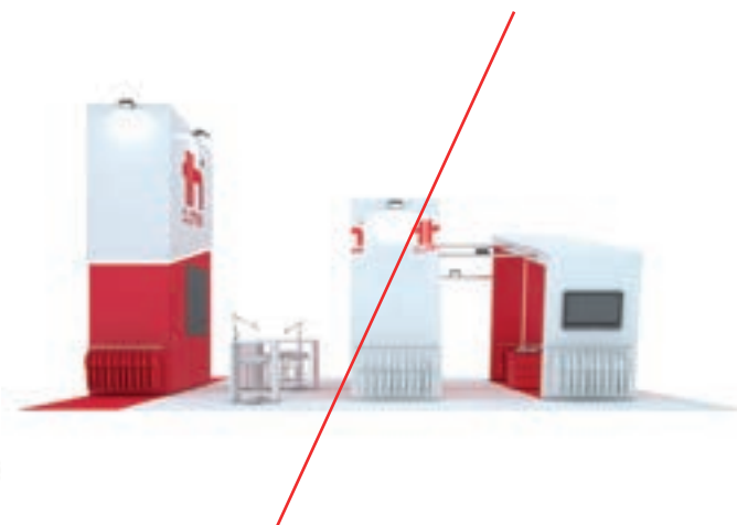
Changer la disposition