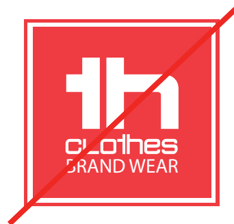
Changer de typographie