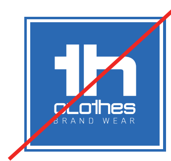
Changer de couleurs