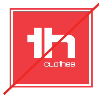
Changer de disposition