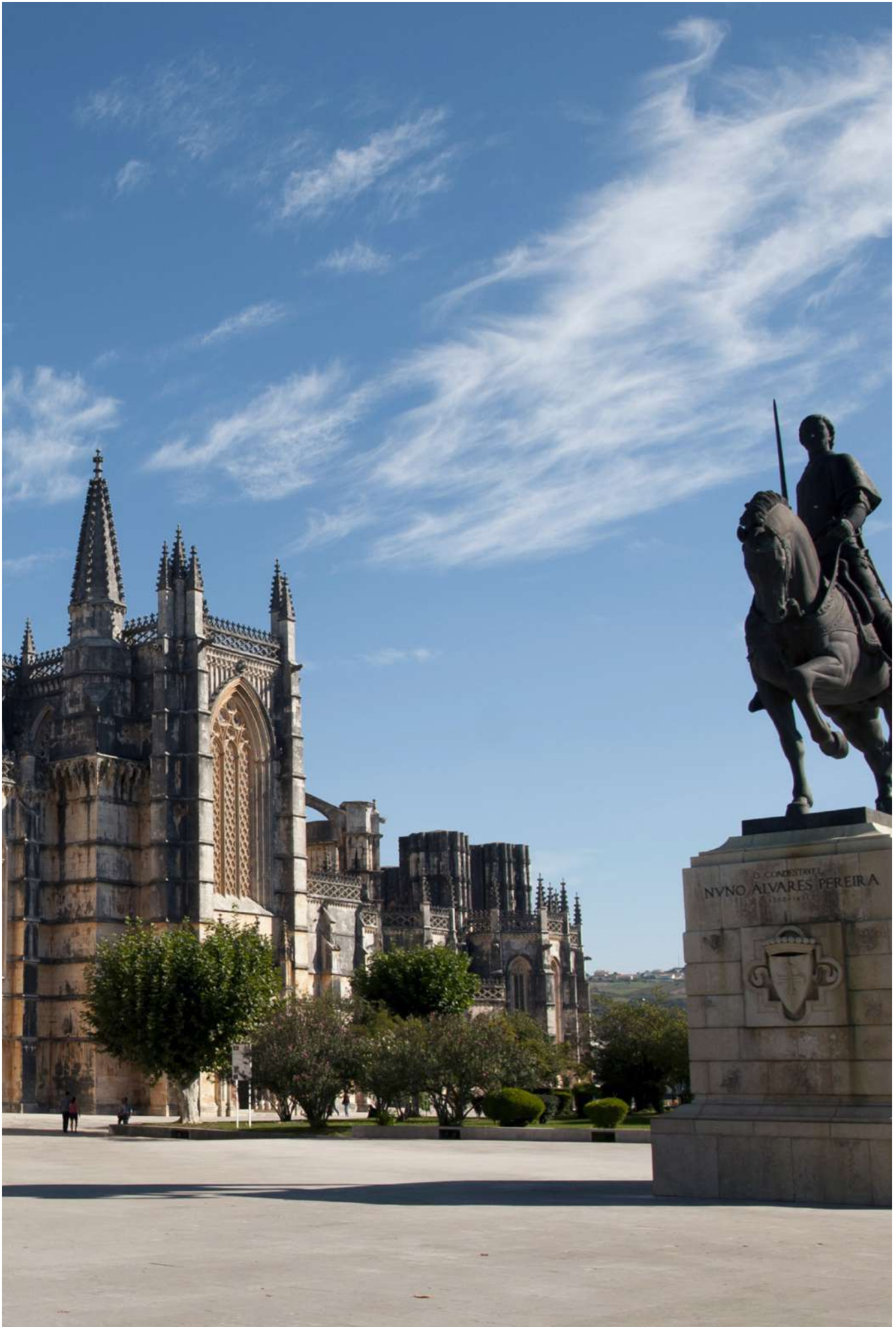
📍 Mosteiro de Santa Maria da Vitória, Batalha, Leiria, Portugal